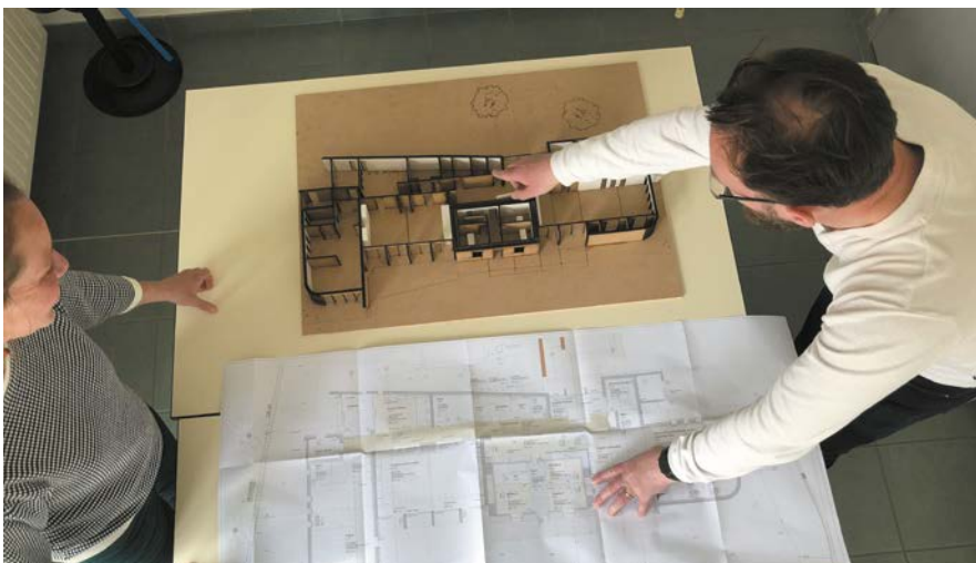
Une maquette du Point Commun a été réalisée par l'Atelier FabLab