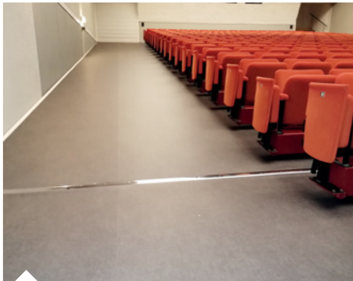
Réfection des sols à Isléa