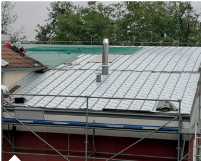
Réfection du toit de la salle des sports C Boissery