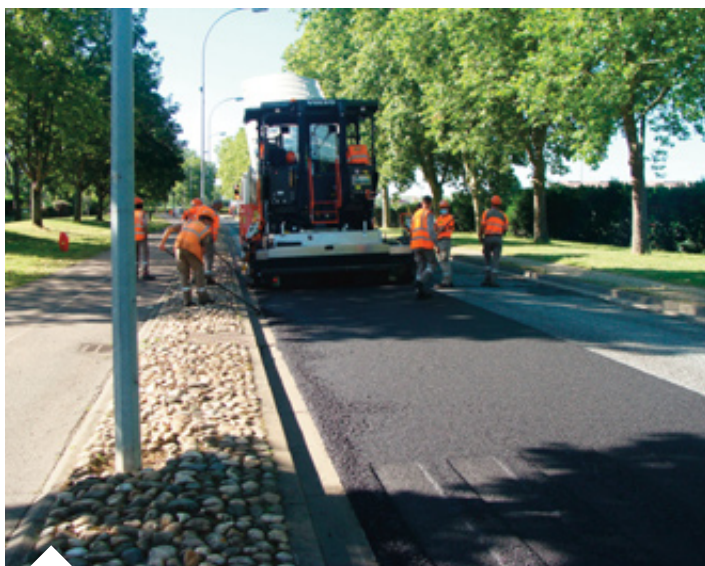
Réfection de la voirie avenue des Isles