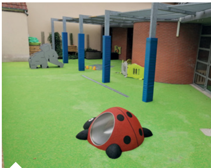
Réfection du sol souple de la crèche