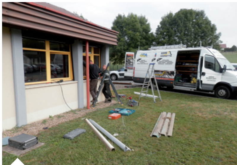
Installation de volets roulants à l'école élémentaire Jean Moulin