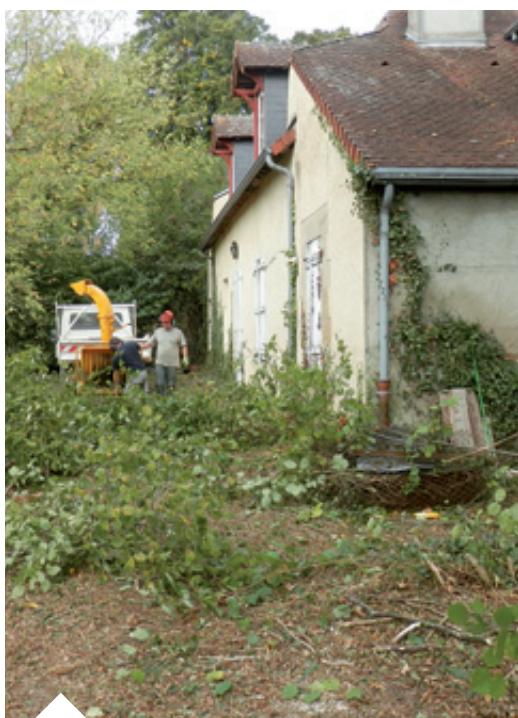
Travaux d'entretien extérieur au presbytère