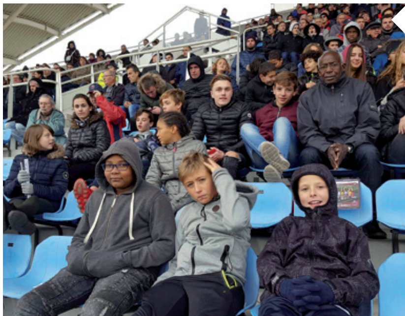
Sortie au stade Gabriel Montpied pour le match Clermont-Foot contre Amiens