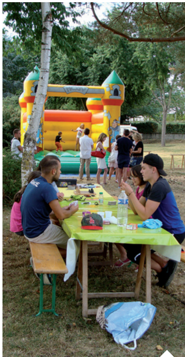
La Junior Association et l'ALJA étaient présents lors de l'évènement « Associations en folie »