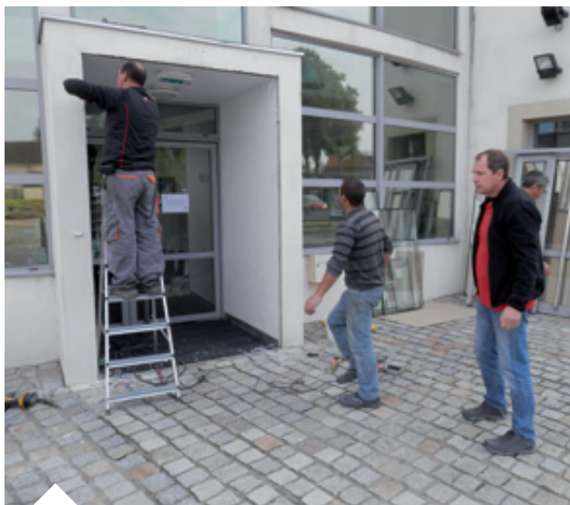
Changement des portes de la mairie