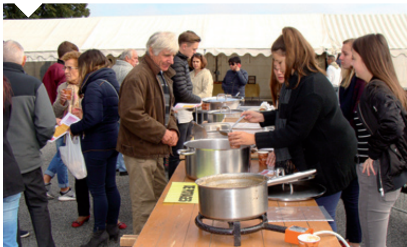
Participation au marché des saveurs d'automne, avec distribution d'excellentes soupes !